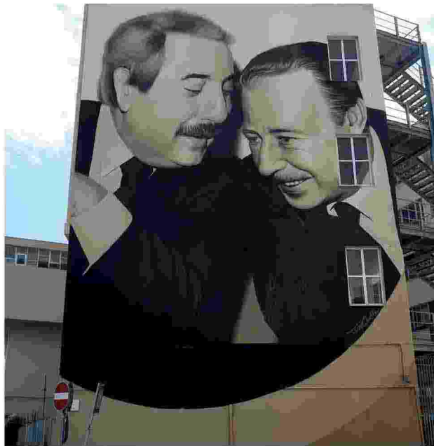
Giovanni Falcone e Paolo Borsellino ritratti in un murales

Lo spettacolo sarà rappresentato per le scuole il giorno prima, giovedì 16 febbraio, in 2 matinée alle ore 9 e alle ore 11.