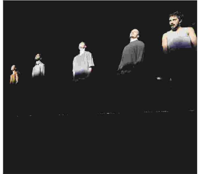
'WE SPEAK DANCE' La rassegna organizzata da Piemonte dal Vivo per far conoscere il meglio del linguaggio coreutico