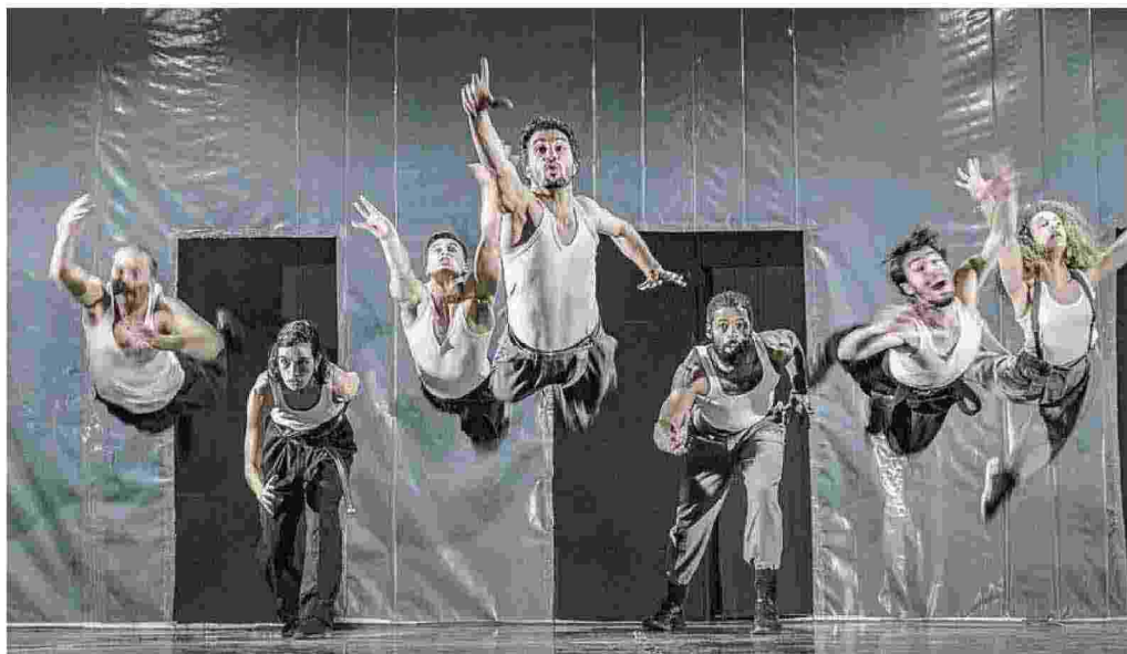
Per We Speak Dance. Ricco calendario di danza contemporanea realizzato da Piemonte dal Vivo